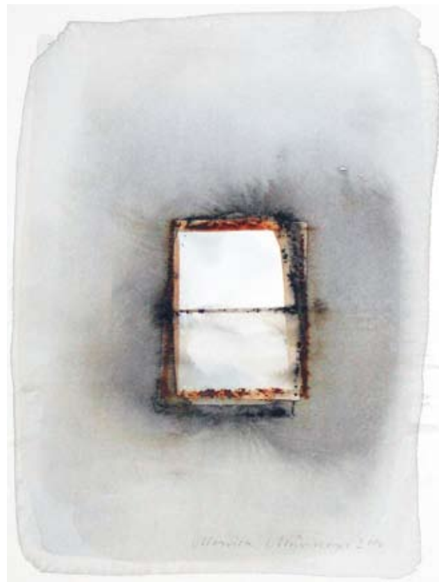
Spegling, 23x17 cm, 2006