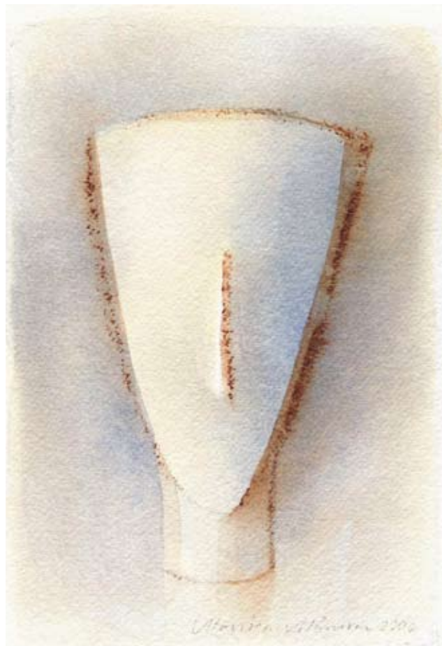
Ansikte, 22x15 cm, 2006

I de här nyare målningarna är färgerna ibland kraftfullare och mera kontrastrika än i de skålar och ansikten jag ser hos henne. Jo visst kan hon gå upp i framför allt blått, hon använder gärna ultramarin (French Ultramarine). Och då dämpar hon helst den kraftiga valören med att lägga en glasskiva över akvarellen, för att den inte ska skrika för mycket.