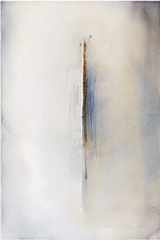
Reflektion, 56x37 cm, 2009