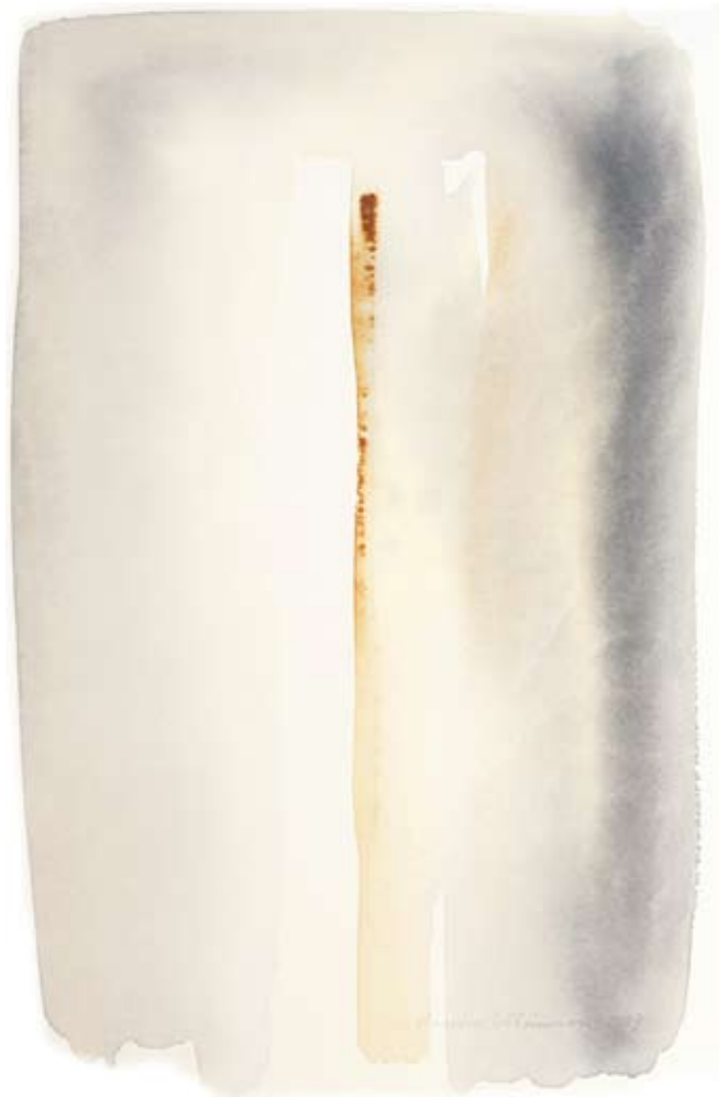
Reflektion, 50x31 cm, 2009